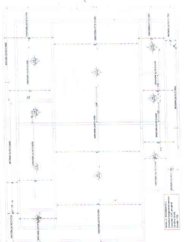
NIVEL 2 - PAVIMENTO 2 Armadura longitudinal superior Cotas em metros Escala: 1:50

Handwritten signature and stamp: CARLOS ALBERTO... PREFEITURA MUNICIPAL DE COIMBRA