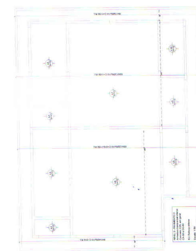
NIVEL 2 - PAVIMENTO 2 Armadura transversal superior Cotas em metros Escala: 1:50