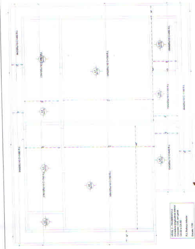
NIVEL 2 - PAVIMENTO 2 Armadura longitudinal inferior Cotas em metros Escala: 1:50