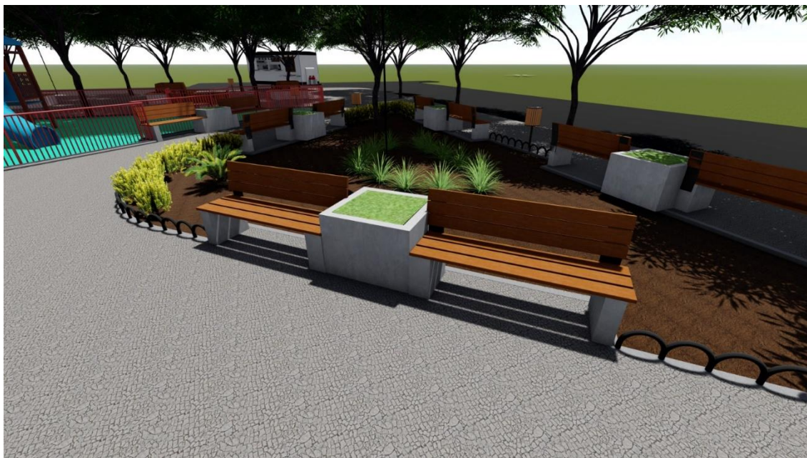
Figura 1 - Banco reto.

Rua Álvaro de Barros, 401 - Centro - CEP: 36.550-000 - COIMBRA - MG C.G.C.: 18.132.464/0001-17 - Telefax.: (32) 3555-1152 / 3555-1214