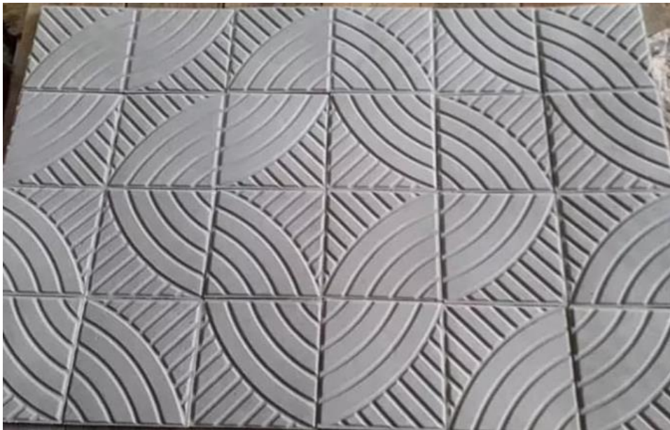
Ladrilho hidráulico antiderrapante.

O piso existente deverá ser demolido e realizado assentamento de ladrilho hidráulico 20x20 cm, na cor natural.