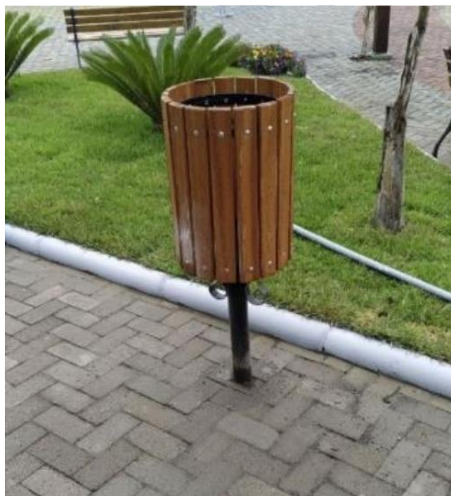
Imagem 5 - Lixeira em madeira com cesto removível.

Rua Álvaro de Barros, 401 - Centro - CEP: 36.550-000 - COIMBRA - MG C.G.C.: 18.132.464/0001-17 - Telefax.: (32) 3555-1152 / 3555-1214