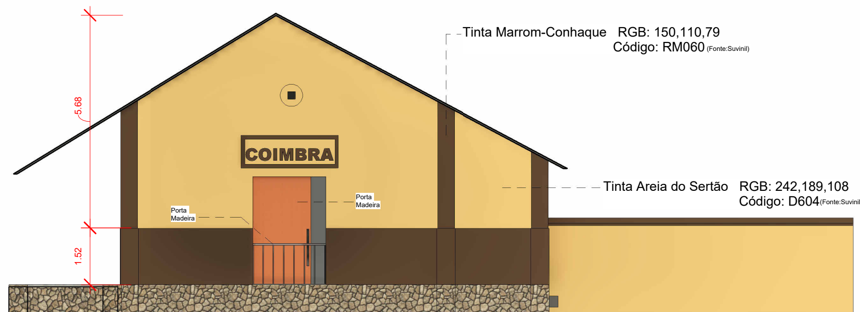
4 Corte B 1 : 100