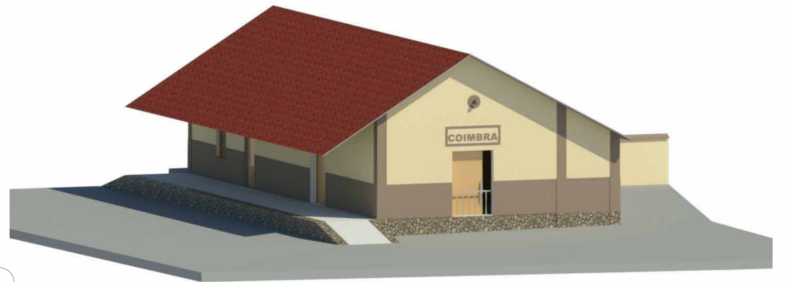
2 3D Render 1 : 1