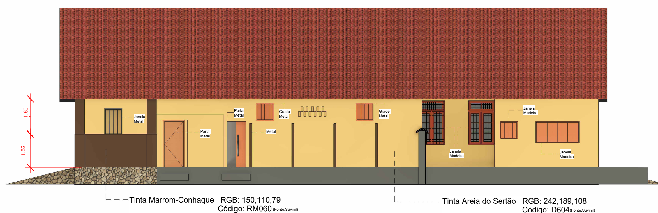
5 Corte C 1 : 100