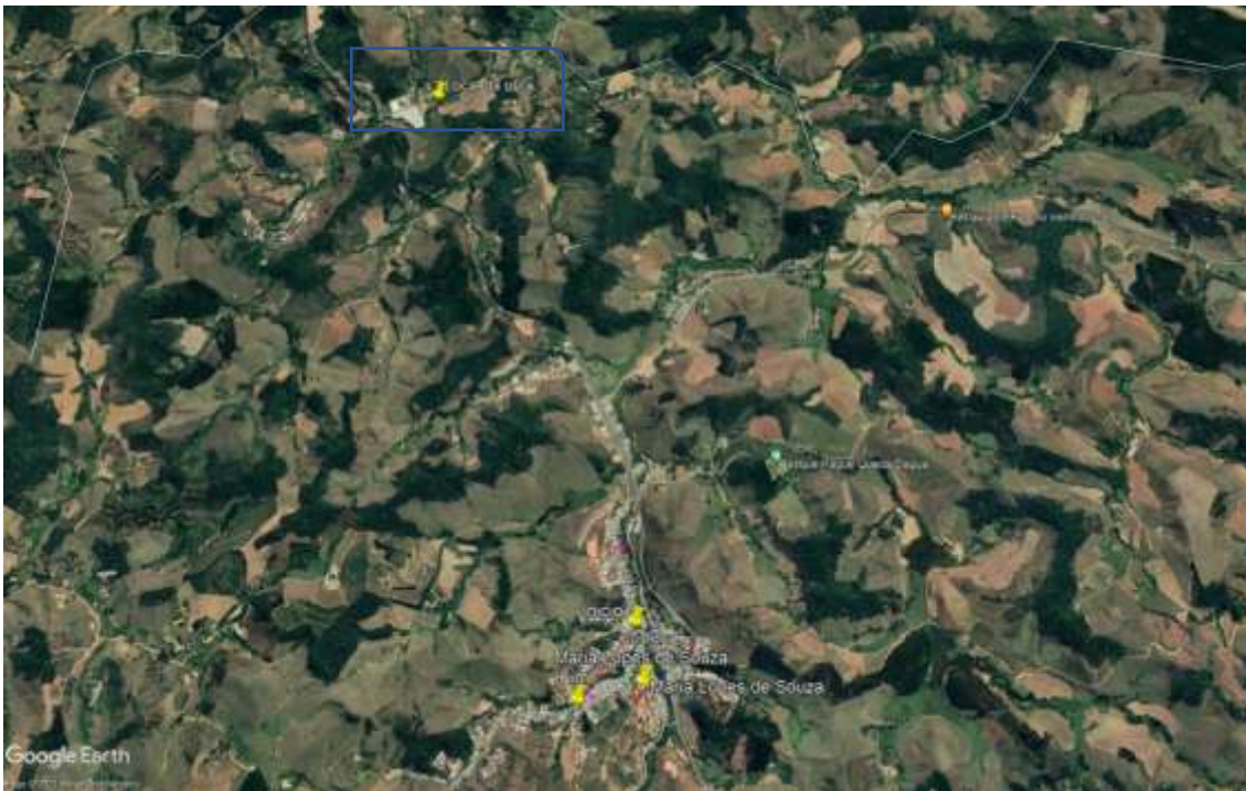
Figura 1- Local da obra

No local existe uma galeria metálica do tipo ARMCO com diâmetro igual a 2 metros. A ala de montante foi destruída com as fortes chuvas ocorridas nos últimos períodos chuvosos. Com isso o talude de aterro esta deslizando, comprometendo a trafegabilidade da via.